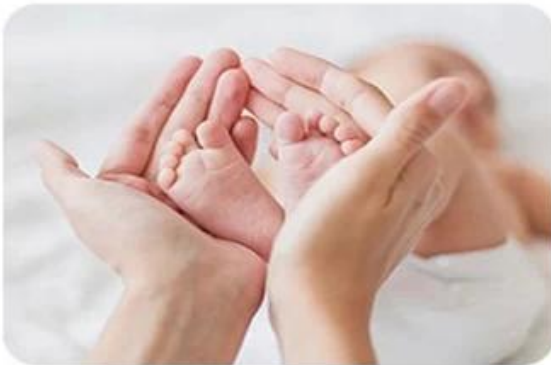
Mother and baby care