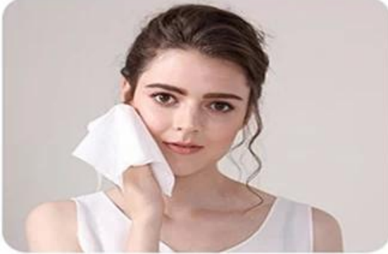
Wash face and wipe sweat