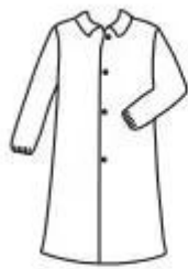
single collar, elastic wrist