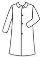
single collar, open wrist