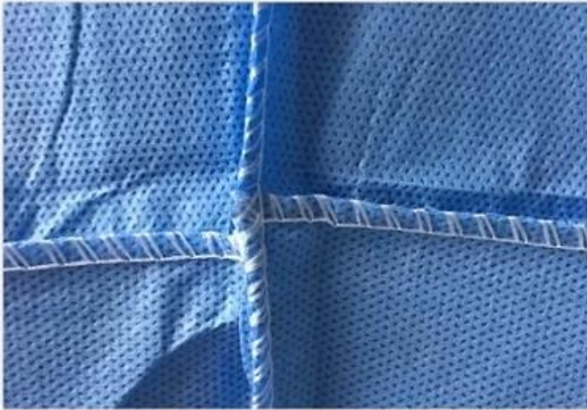
Ultrasonic sealing seams