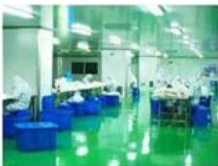
Dust free packing workshop