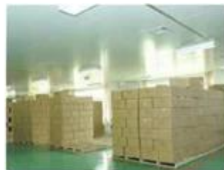
Finished products warehouse