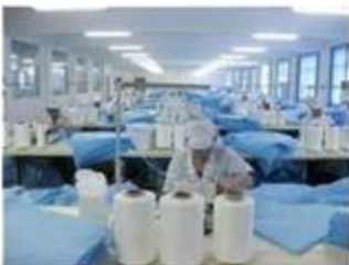
Dust free sewing workshop