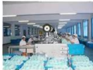
Dust free mask workshop