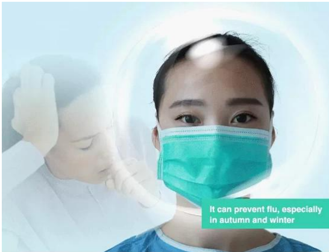
Weitere Begriffe von Tie-on Auto Machine Super Soft Anti-Fog Gesichtsmaske